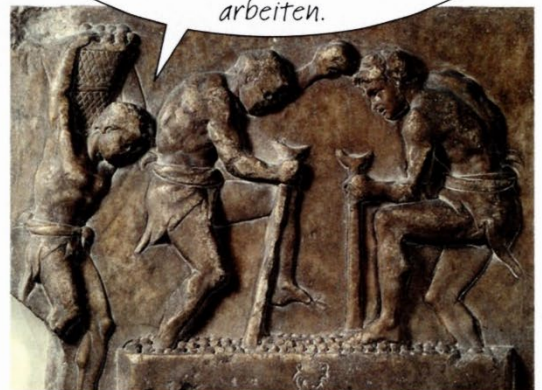
1 Sklaven beim Weinkeltern, Relief

Ich komme aus Syria. Als Soldat habe ich gegen die Römer gekämpft. Ich wurde gefangen genommen und als Sklave verkauft. Jetzt muss ich für einen Gutsbesitzer arbeiten.